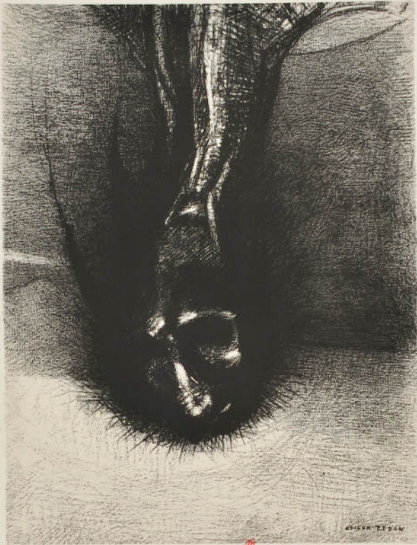
les xanopods ...la tête la plus basse possible, c'est le secret du bonheur !