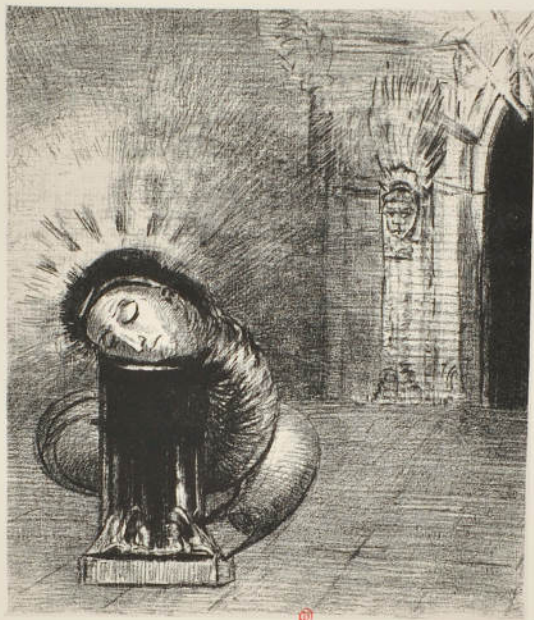
... une longue épreuve de douleur de sang